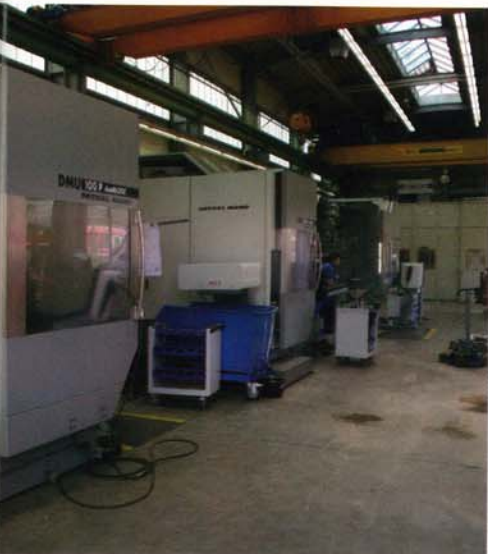
Drei DMU 100 und das Wotan Bohrwerk für die Großteilefertigung

Anfänglich rüstete Stark eine DMU 100 bei Lewa mit dem Nullpunktspannsystem Speedy 2000 aus. Hier entschied man sich für eine modifizierte 8-fach Auslegung mit einem etwas größeren Stichmaß, um bessere Kippmomente zu schaffen. Bei diesem System werden durch Federkraft die