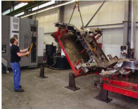
Rüst- und Ablageplätze: Besonders bei Großteilen ist das Handling entscheidend: Die Palette für die Wotan wird für das Umrüsten umgelegt.