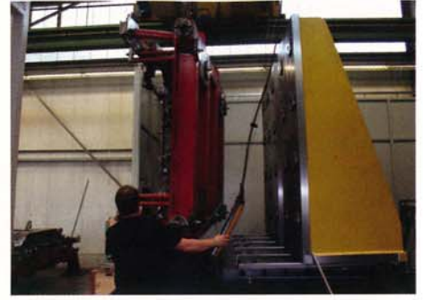
Wotan: Maschinentisch mit Winkel 1 und Winkel 2. Die Beladung erfolgt mit dem Hallenkran. Die "Dritte Hand Funktion" und optionale Spannkontrolle sind ebenso ein Handlings-Vorteil wie die optische Lösekontrolle.