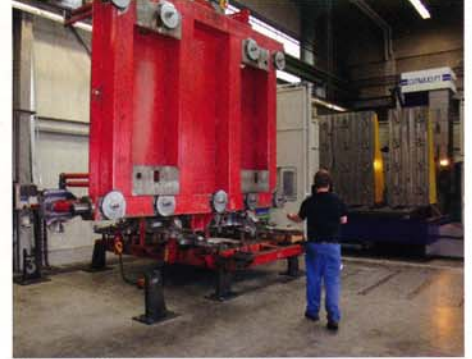
Wotan: Maschinentisch mit Winkel 1 und Winkel 2. Die Beladung erfolgt mit dem Hallenkran. Im Vordergrund: Rüst- und Ablageplätze.

Einzugsnippl permanent formschlüssig und höchst präzise fixiert. Gelöst wird hydraulisch. Dank der speziellen Nippelform entstehen beim Palettenwechsel keine Beschädigungen der Passungen. Aufgrund des häufigen Spannzyklus auf dieser Maschine konnte man in kürzester Zeit die Spannzeit erheblich reduzieren und somit die Produktivität der Maschine enorm erhöhen. Nachdem Lewa mit der Qualität, der Genauigkeit, den Spannvorgängen und der Rüstzeit vollstens zufrieden war, wurden mittlerweile nicht nur zwei weitere DMU 100 mit Stark Spannsystemen ausgestattet, sondern auch